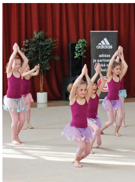
• T.J. Sokol Michle, Hvězdička