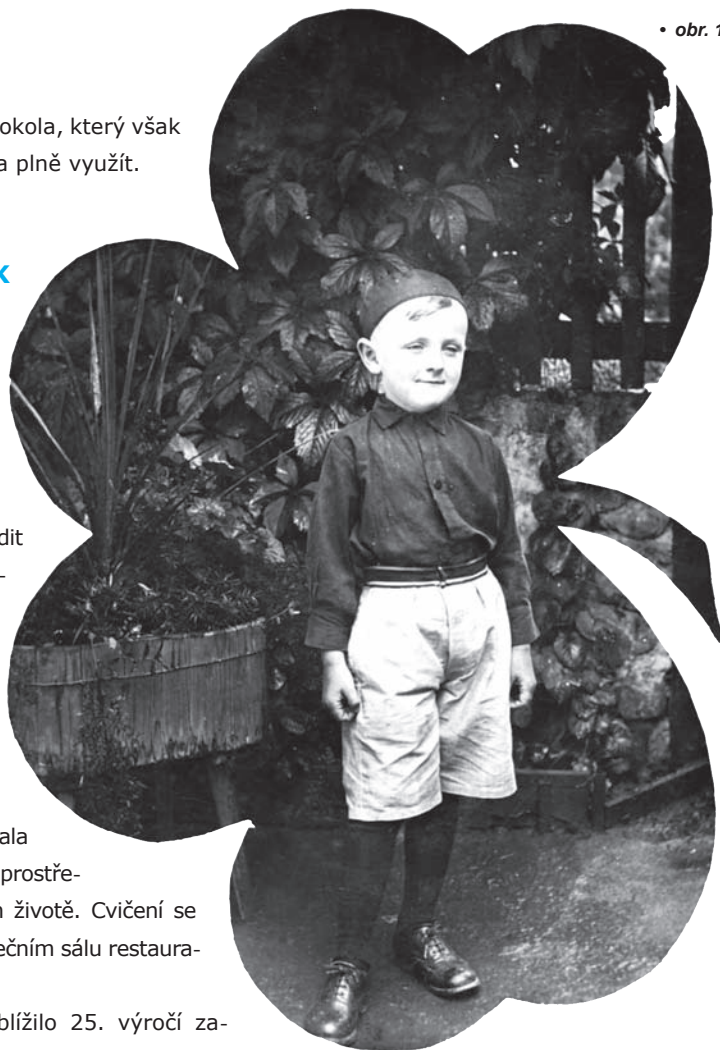
• obr. 1

Když se tenkrát blížilo 25. výročí založení jednoty, projevila se silná touha zbudovat vlastní sokolovnu, což se stalo hlavním motivem usnesení valné hromady v r. 1929. Téhož roku byl slavnostně položen základní kámen ke stavbě sokolovny. Pro všechny členy jednoty začalo období nezištné, obětavé a vyčerpávající práce. Přes 4000 hodin bylo odpracováno jen při úpravě terénu a hloubení základů. Na darech a bezúročných půjčkách bylo získáno 85 000 Kč. Hodin schůzování a vytrvalého zařizování členů stavební komise a výboru jednoty bylo nepočítaně. Projekt architekta Kopřivy byl v červenci 1929 jednotou přijat a již v srpnu bylo započato se stavbou. Ta byla slavnostně otevřena 22. června 1930.