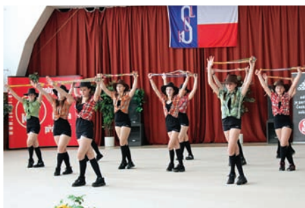
• T.J.Sokol Horoměřice, Ropes Country