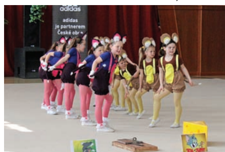
• T.J.Sokol Bezděkov, Tom a Jerry