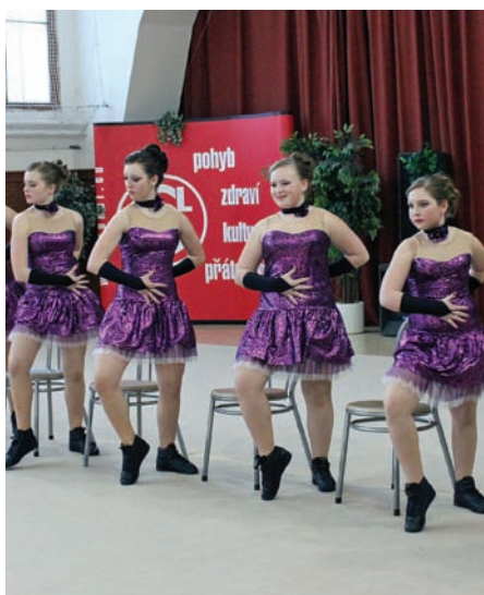
• T.J.Sokol Jičín, Tango