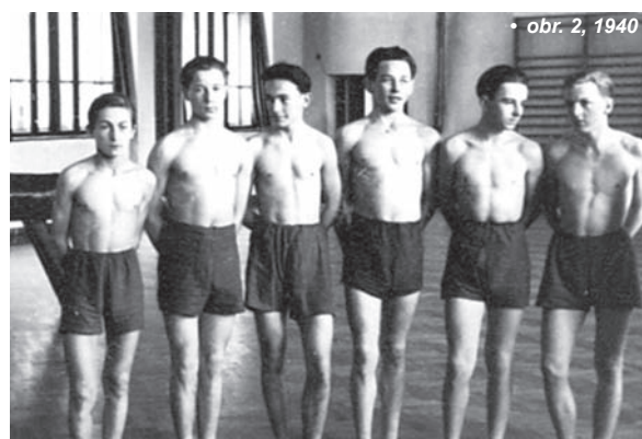
• obr. 2, 1940

V roce 1936 jsem byl přijat na reálné gymnázium v Brně-Žabovřeskách a přestoupil jsem do sokolské jednoty v tomto brněnském předměstí. Jednota, založená 1898, měla k dispozici nově vybudovanou tělocvičnu v měšťanské škole a k tomu nádherný areál téměř v lesním prostředí, kterému se proto říkalo „Pod lesem“. V tělocvičně nabízela mládeži i dospělým cvičení na náradí a basketbal, na hřišti se pak provozovala atletika, volejbal a basketbal. Mohlo by se to přirovnat k dobře založené sportovní všestrannosti, o které se rovněž píše v tomto čísle. Kdo chtěl soutěžit, měl možnost. A tak se stalo, že naše družstvo 15letých mladších dorostenců (obr. 2, autor je poslední vpravo) vyhrálo v roce 1939 soutěž v gymnastickém víceboji. Když byl v roce 1941 zavřen Sokol, přešlo celé sportovně založené jádro do fotbalového klubu SK Žabovřesky. Přeneslo se tam i vynikající sociální klima s četnými kamarádkými vztahy. Výběr sportovních aktivit se poněkud snížil, ob-