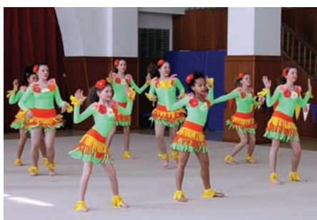
• T.J.Sokol Rychvald WakaWaka