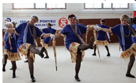
• T.J.Sokol Hronov, Dámičky