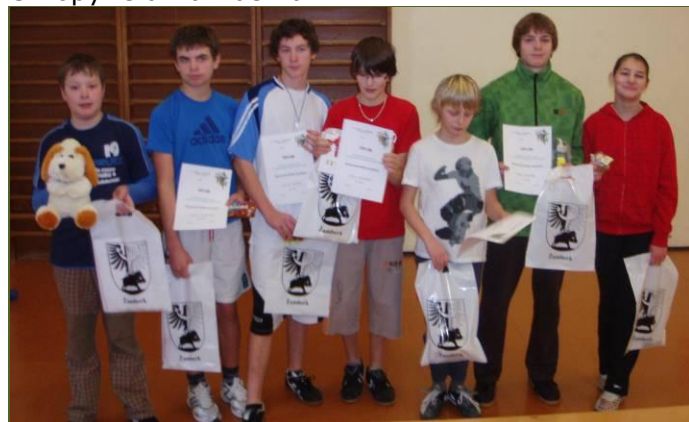
Účastníci žákovského turnaje

žáků, kterého se zúčastnilo 7 hráčů ze Líšnice, Chropyně a Žamberka.