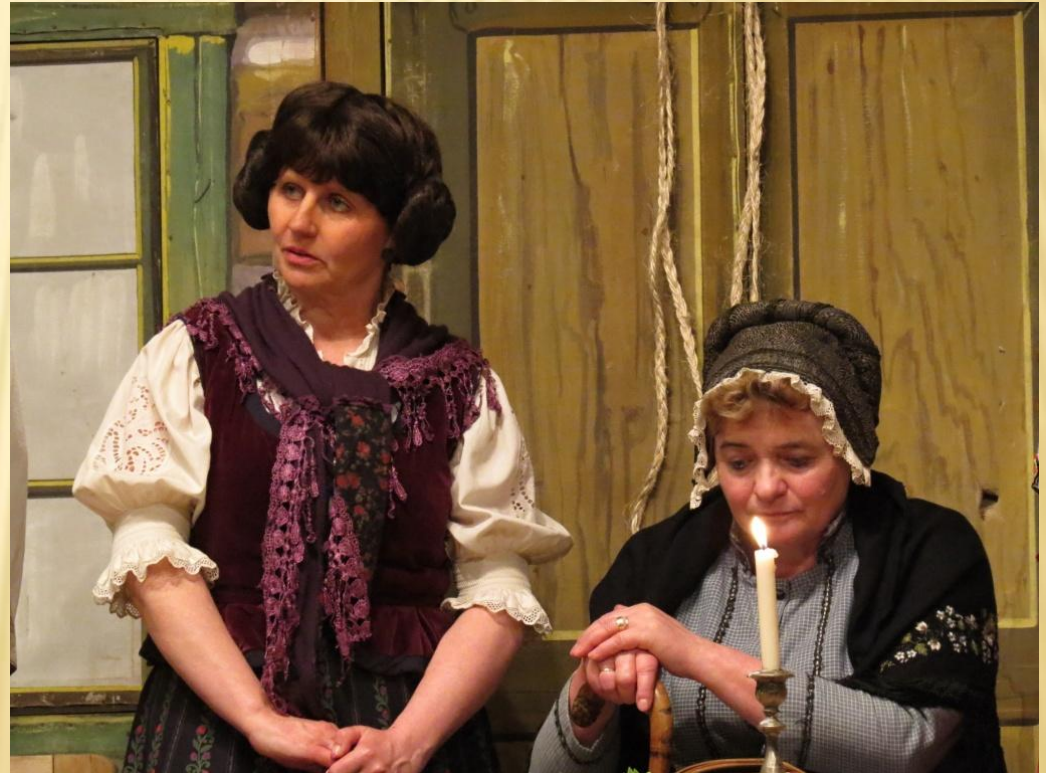
Klásková u publika výrazně zabodovala, ale doma by takovou driáčnici asi nikdo nebral.